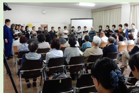
第5回学園祭の様子